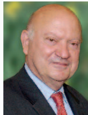
Exemple André André SANTINI Ancien Ministre Maire d'Issy-les-Moulineaux Vice-Président de la Métropole du Grand Paris