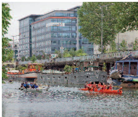
Défi pirogue entre les entreprises Sodexo et SFR

Pratiquer un sport, se défouler, se relaxer, autant d'activités qui, pratiquées au sein d'une entreprise, permettent de réduire le stress, de renforcer la cohésion de groupe, et contribuent à la performance économique de l'entreprise. De plus les effets bénéfiques du sport sur la santé ne sont plus à démontrer.