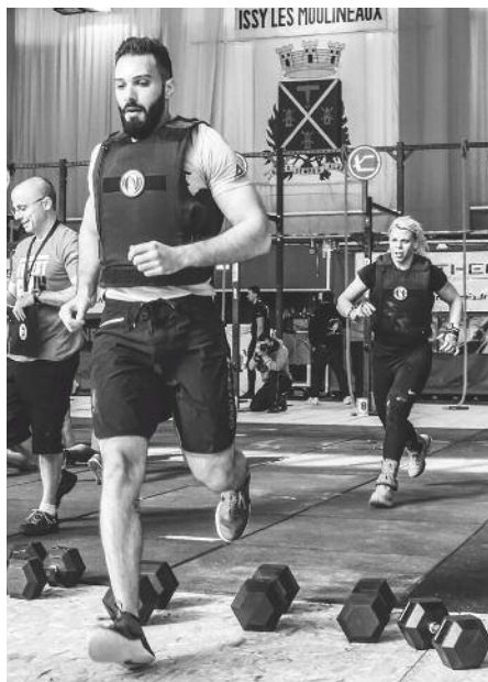
Compétition de Crossfit The Fittest Cop

La Ville organise par ailleurs chaque année, seule ou en partenariat, une vingtaine d'événements sportifs qui sont devenus, à l'image de la Corrida de Noël (voir page 28), des moments forts et incontournables de la vie isséenne.