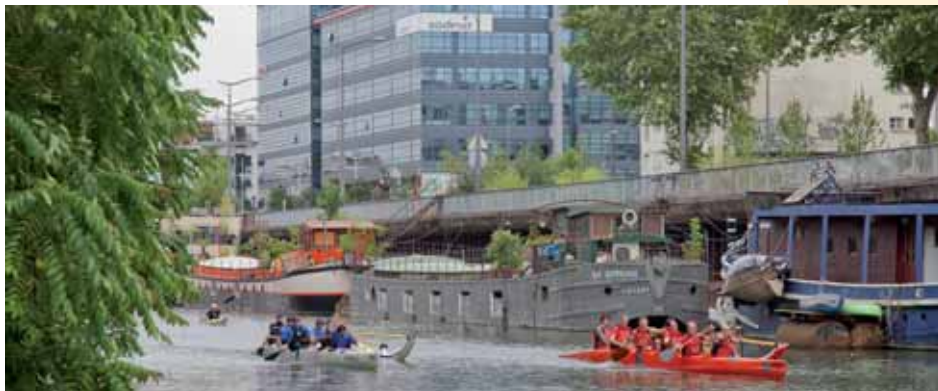
Défi pirogue entre les entreprises Sodexo et SFR

Diverses activités et tournois sont proposés (voir page 65) ■