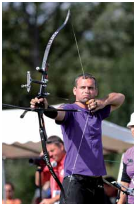
Championnat de France de tir à l'arc campagne.

La Ville organise par ailleurs chaque année, seule ou en partenariat, une vingtaine d'événements sportifs qui sont devenus, à l'image de la Corrida de Noël (voir page 28), des moments forts et incontournables de la vie isséenne.