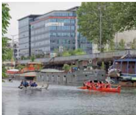
Défi pirogue entre les entreprises Sodexo et SFR

Pratiquer un sport, se défouler, se relaxer, autant d'activités qui, pratiquées au sein d'une entreprise, permettent de réduire le stress, de renforcer la cohésion de groupe, et contribuent à la performance économique de l'entreprise. De plus les effets bénéfiques du sport sur la santé ne sont plus à démontrer.