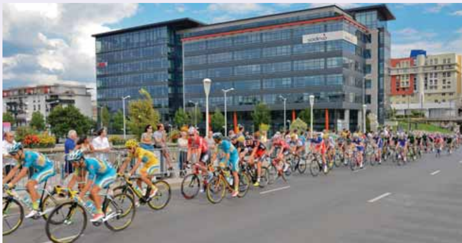
Passage du Tour de France à Issy