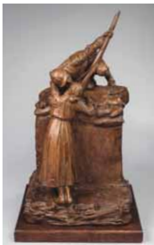
Le baiser du soldat, Max Blondat

Jusqu'au 8 mars, le Musée des années 30 de Boulogne-Billancourt rend hommage aux artistes qui ont mis leur talent au service de l'effort de guerre durant la Première Guerre Mondiale. Sorties des réserves du musée, les pièces, sculptures, affiches et autres cartes postales en exposition n'avaient encore jamais été montrées au grand public.