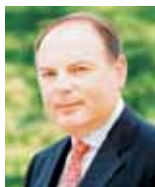
Le président de la Communauté d'Agglomération Grand Paris Seine Ouest