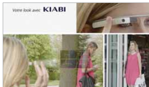
Niji a lancé « Kiabi Look » sur Google Glass : une application qui permet de prendre une photo d'un article et de se voir proposer le ou les vêtements similaires dans la collection Kiabi

Grâce aux nouvelles technologies, les marques et enseignes redoublent d'ingéniosité pour amener les consommateurs dans leurs points de vente et améliorer leur parcours d'achat. Niji (Issy), société de conseil et de réalisation logicielle, vient par exemple de lancer Kiabi Look sur Google Glass. L'application permet de prendre une photo d'un article (dans la rue ou sur un magazine) et de se voir proposer le ou les vêtements similaires dans la collection Kiabi. Dans une logique cross canal , la sélection est envoyée sur son smartphone pour passer commande, réserver l'article ou venir le voir en magasin.