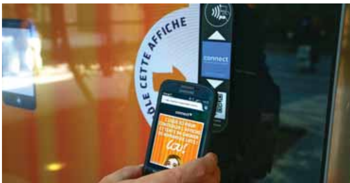
Clear Channel a développé des bornes publicitaires offrant des contenus enrichis grâce notamment à la technologie NFC

Enfin, 150 commerces de Boulogne-Billancourt testent actuellement l'application mobile Fivory. Selon eux, son approche intégrée - offres géolocalisées, carte de fidélité et paiement sans contact - est prometteuse. ■