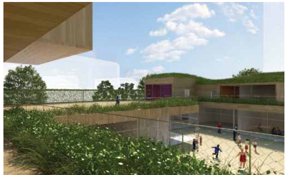
La ZAC des Bords de Seine achève sa mue. Une nouvelle école Haute Qualité Environnementale va ouvrir ses portes.