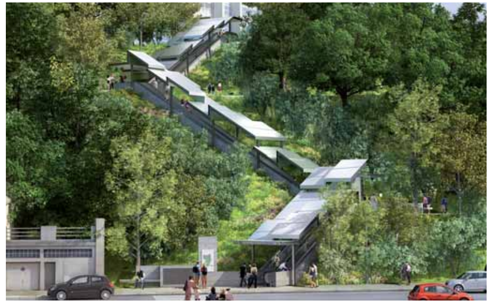
Le chantier des escaliers mécaniques arrive à son terme. L'équipement permet de mieux desservir les Hauts d'Issy et le boulevard Rodin.