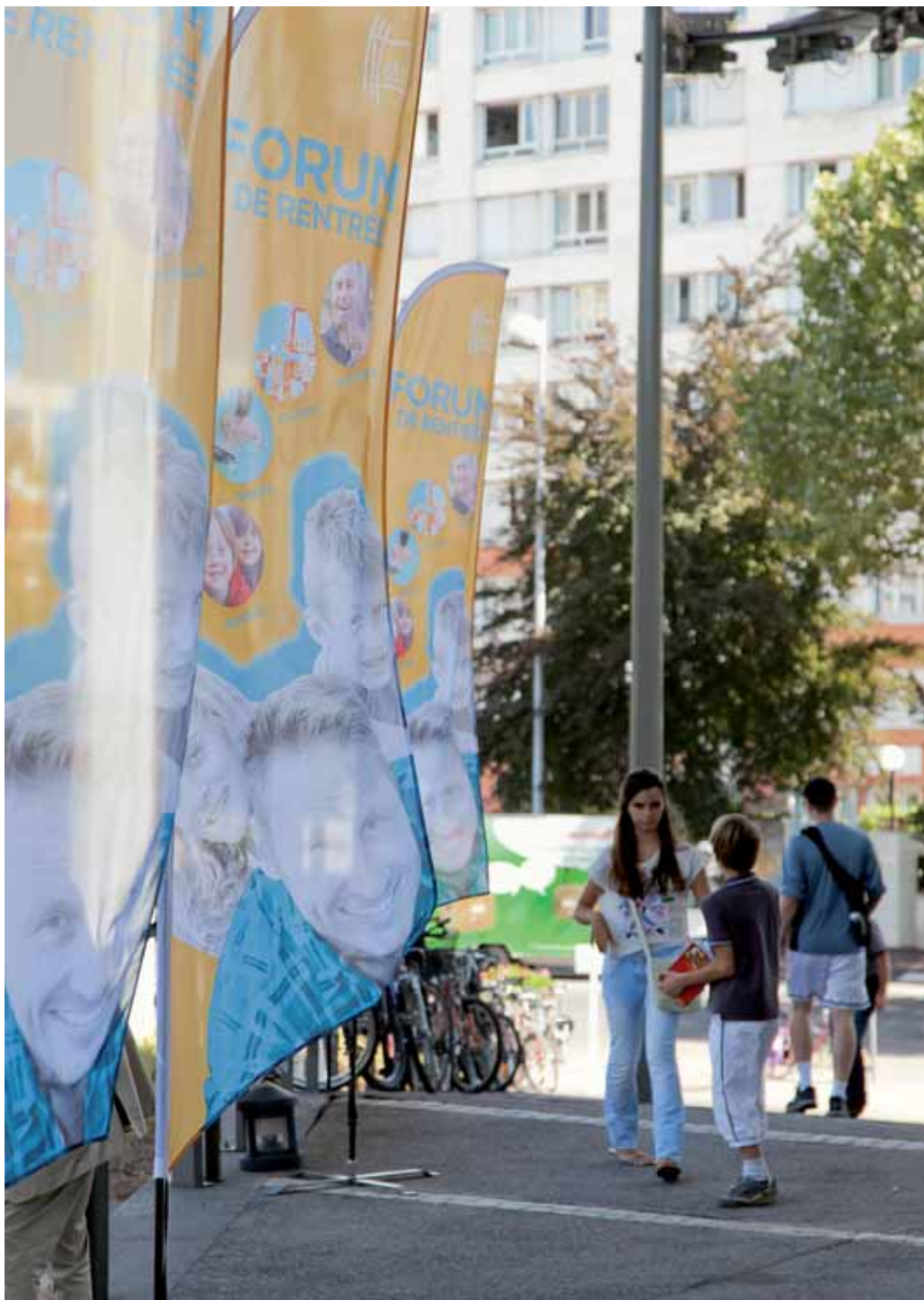
Rendez-vous au Palais des Sports Robert Charpentier pour la 37 e édition du Forum de Rentrée. Inscriptions aux activités sportives, culturelles ou sociales, animations et rencontres, détente et engagement bénévole sont au programme.