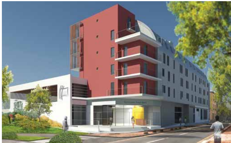
Le gymnase Paul Bert va rouvrir ses portes.