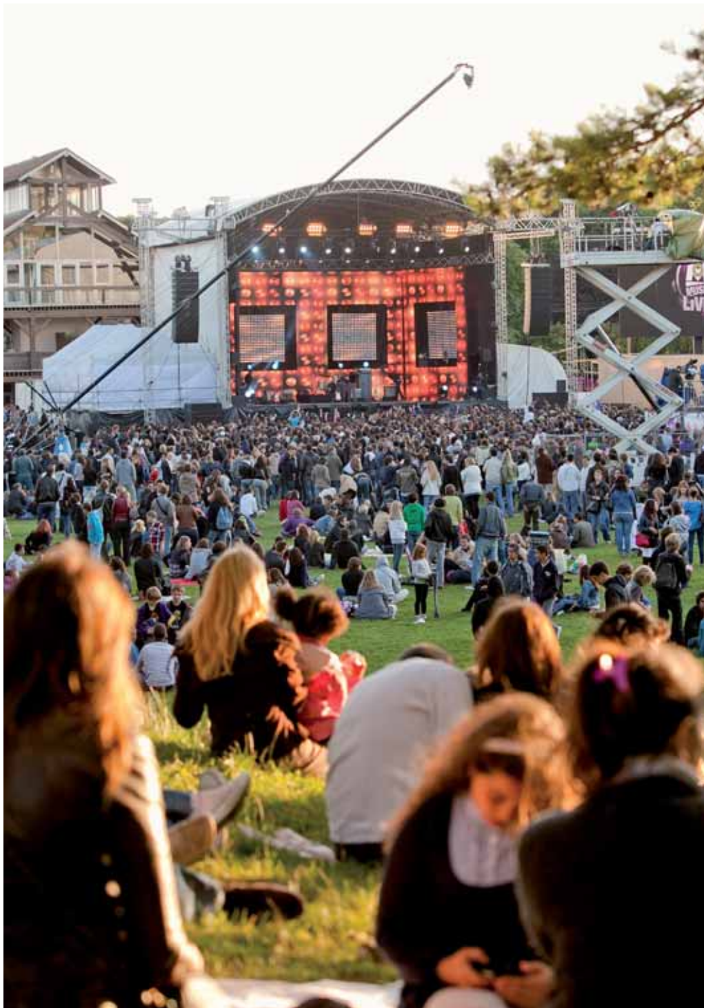
Grand concert gratuit sur le parc de l'Île Saint-Germain, fête de la musique et Festival Jazz au Cœur et Guitare à l'Ame du 20 au 29 juin... de bonnes soirées en perspective.

L'espace culturel « Le Temps des Cerises » au Fort accorde une large place aux ateliers et jeux numériques.