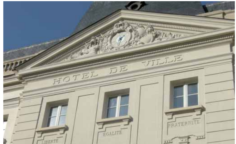
Les élections municipales auront lieu les dimanches 23 et 30 mars et les élections européennes auront lieu dimanche 25 mai.