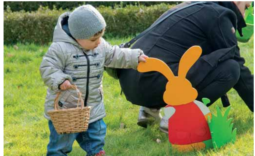
Dimanche 20 avril, c'est le moment de chasser les œufs dans les parcs Henri Barbusse et Jean Paul II.

Certains conseillers municipaux représentent la commune au sein des organes délibérants des communautés de communes, des communautés d'agglomération, des communautés urbaines et des métropoles.