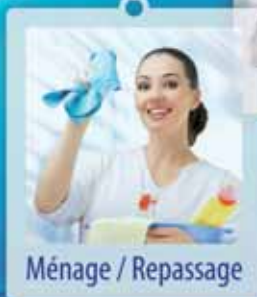
Ménage / Repassage