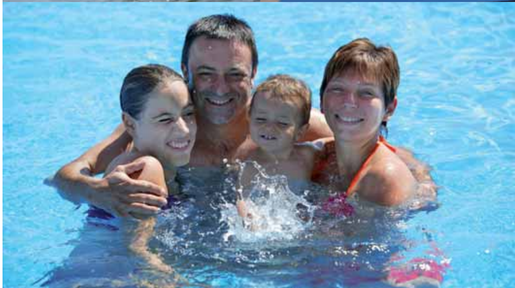
Avec la carte « Pass'sport », découvrez de nombreuses activités pour un été sportif.