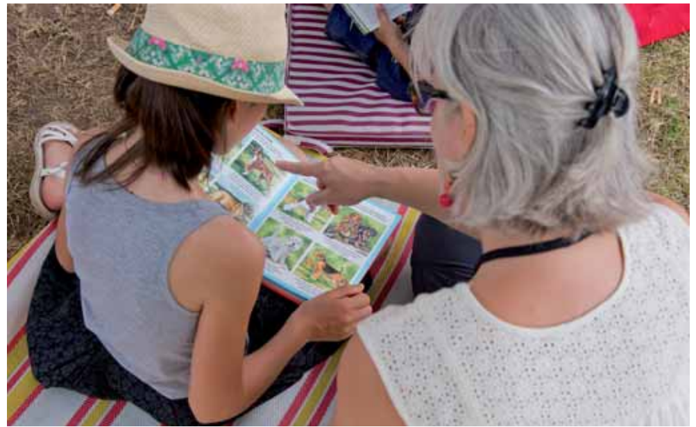
En juillet et en août, les bibliothécaires font escale dans le parc de l'île Saint-Germain pour offrir une sélection de livres, journaux et magazines.