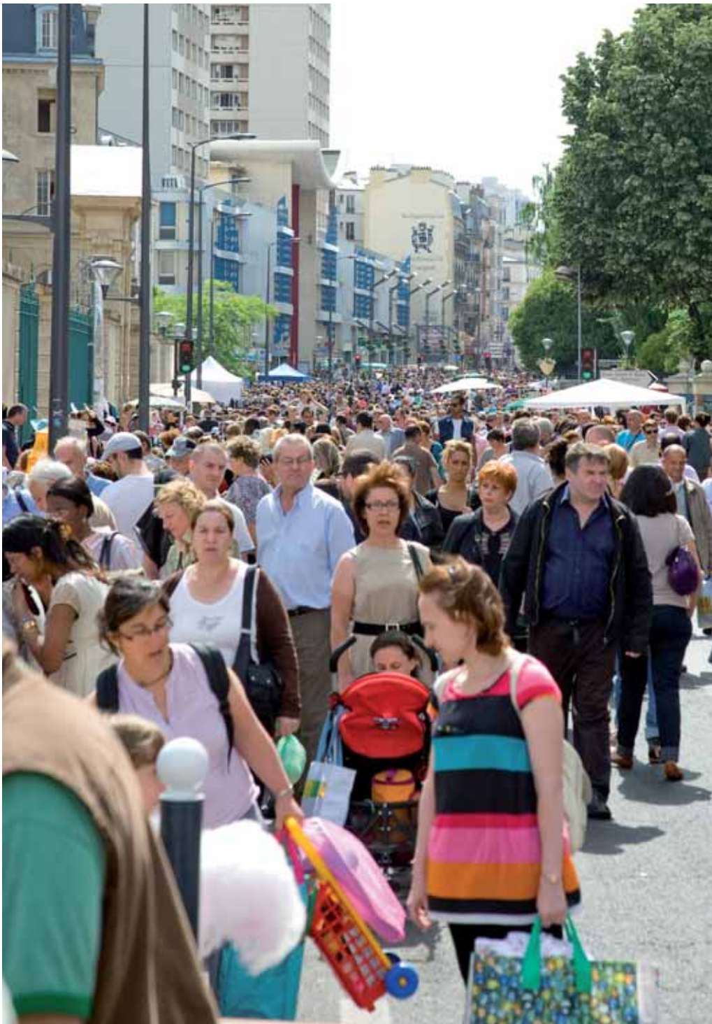
Chineurs et curieux, rendez-vous aux Printemps d'Issy pour une journée conviviale et festive ! Cette année, les Printemps d'Issy auront lieu dimanche 18 mai.