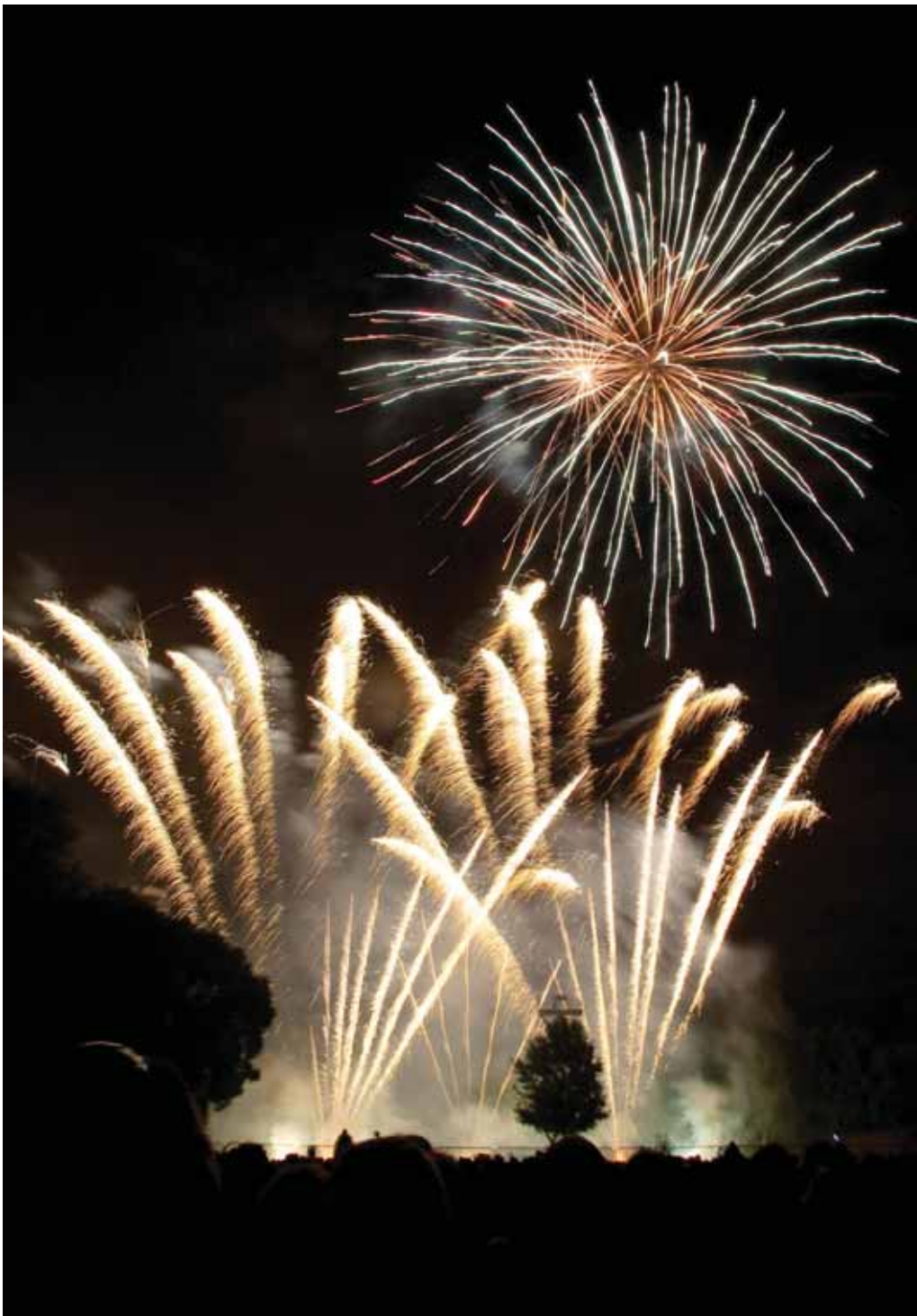
Participez en famille ou entre amis aux traditionnelles animations pour la Fête Nationale : retraite aux flambeaux, feu d'artifice ou encore bal des pompiers.